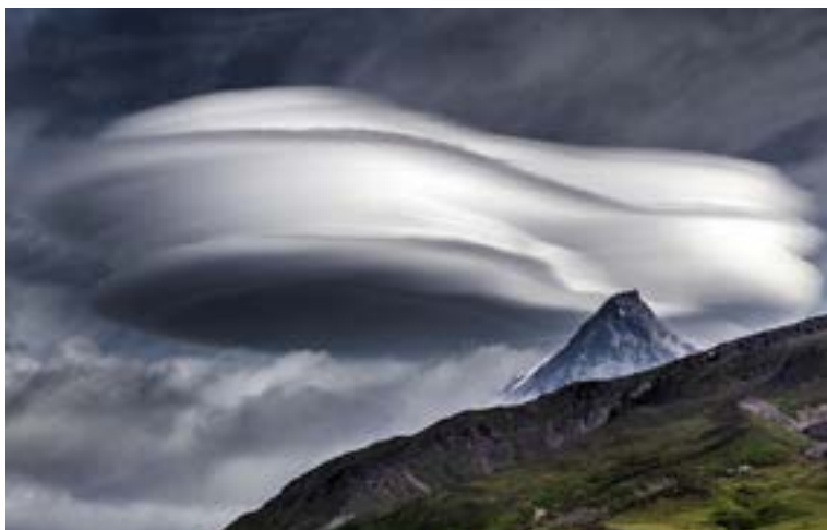
“Wij zullen wolkkolommen bij dag...” (Foto van UFO-wolken boven Kamchatka schiereiland, op 14 augustus 2015.)