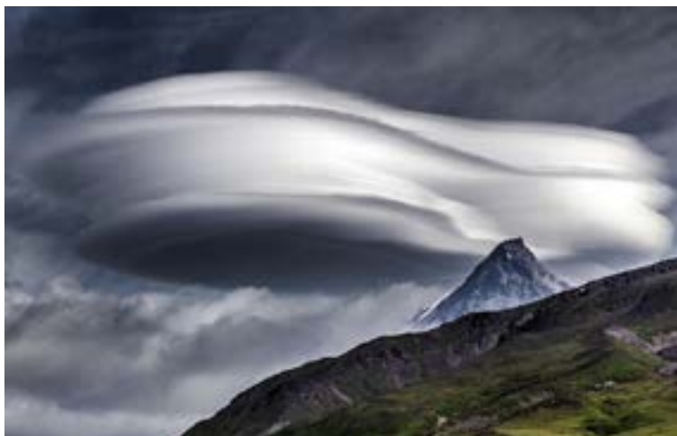
“Wij zullen wolkkolommen bij dag...” (Foto van UFO-wolken boven Kamchatka schiereiland, op 14 augustus 2015.)